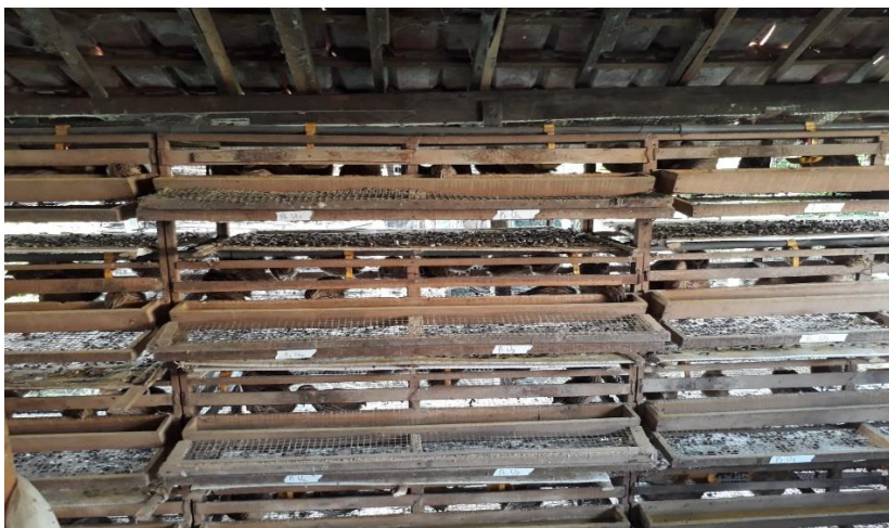
Persiapan sebelum penelitian