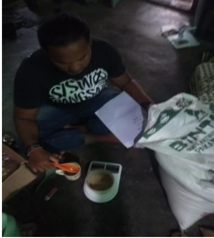
Proses penimbangan pakan