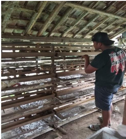
Proses pemberian pakan