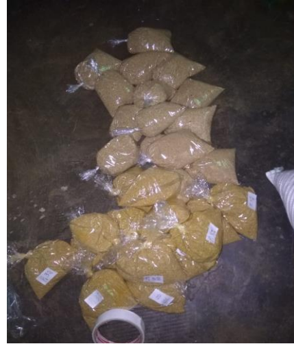
Proses pembungkusan pakan