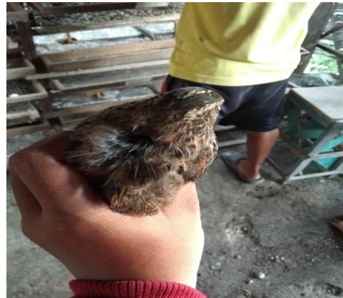
Puyuh ras hitam