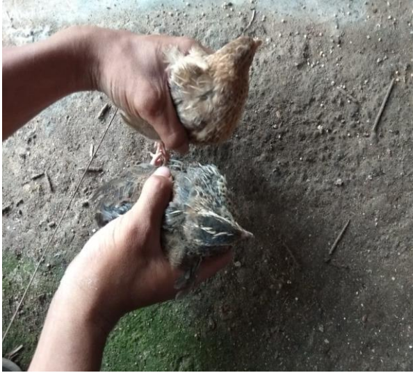
Perbedaan puyuh ras hitam dan ras coklat