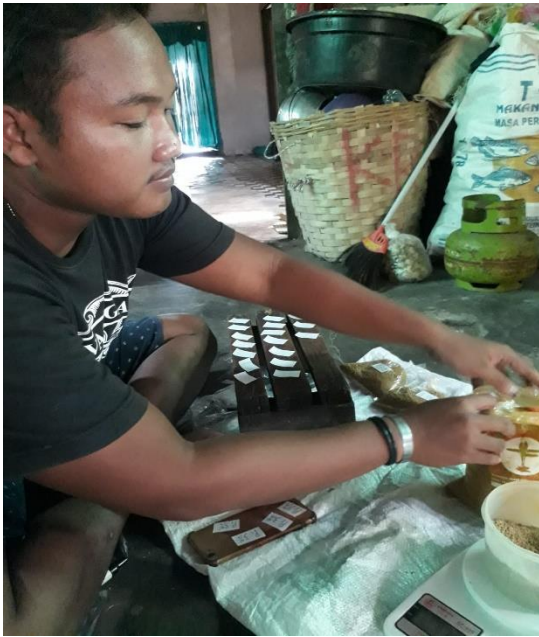
Penimbangan sekaligus penyampuran tepung kunyit