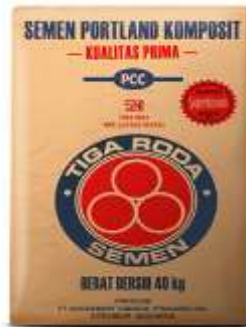
Gambar 2.4 Semen Portland Tipe 3