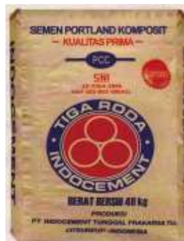
Gambar 2.5 Semen Portland Tipe 4