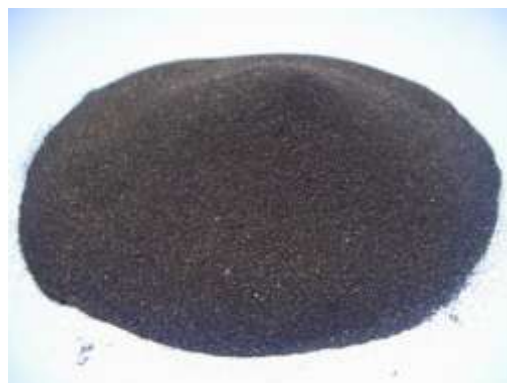
Gambar 2.7 Agregat halus