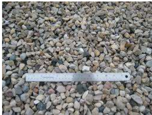
Gambar 2.8 Agregat Kasar

Agregat kasar adalah bila ukuran partikel lebih besar dari 4,75 mm ayakan no. 4 (Tri Mulyono, 2005). Sifat agregat mempengaruhi kekuatan akhir dari beton keras dan daya tahannya terhadap pengaruh cuaca dan efek-efek perusak lainnya. Agregat kasar harus bersih dari bahanbahan organik dan mempunyai ikatan yang baik dengan semen.