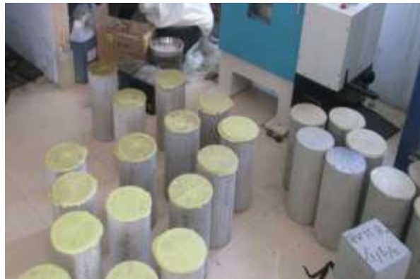
Gambar 2.1 Beton

Beton adalah bahan konstruksi yang merupakan struktur sederhana yang dibentuk oleh campuran semen, air, aggregate halus dan kasar serta bahan campuran lainnya. Beton didefinisikan sebagai campuran dari bahan penyusunnya yang terdiri dari bahan semen hidrolis ( Portland cement ) aggregate kasar, aggregate halus dan air dengan atau menggunakan bahan tambah ( admixture ) atau ( additive ).