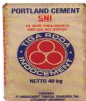
Gambar 2.3 Semen Portland Tipe 2