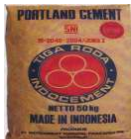
Gambar 2.2 Semen Portland Tipe 1