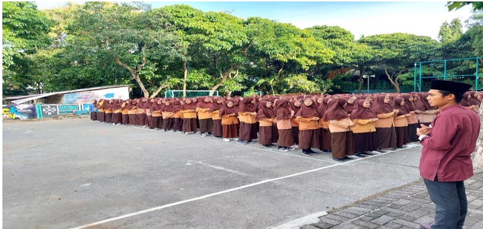
Gambar 4: Kegiatan Membaca Sholawat Nariyah di MA Ma'arif 7 Banjarwati