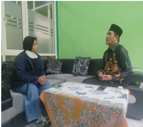
Gambar 1: Wawancara dengan Guru MA Ma'arif 7 Banjarwati